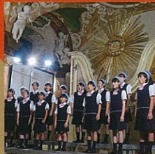
山陰少年少女合唱団 リトルフェニックス