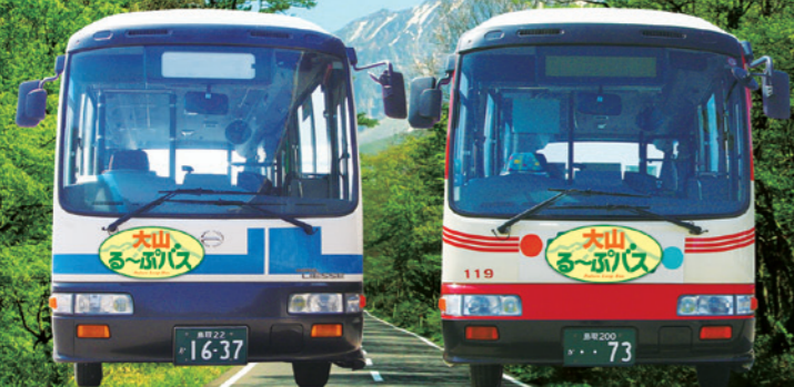
発行/大山エリア観光二次交通整備推進協議会