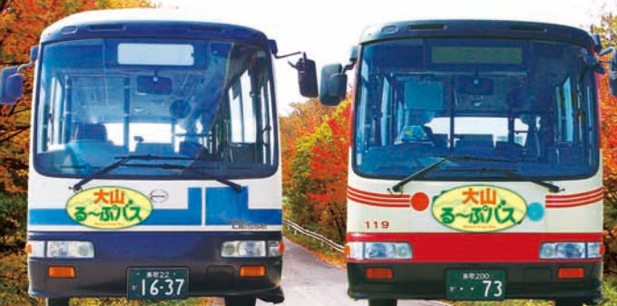
発行/大山エリア観光二次交通整備推進協議会