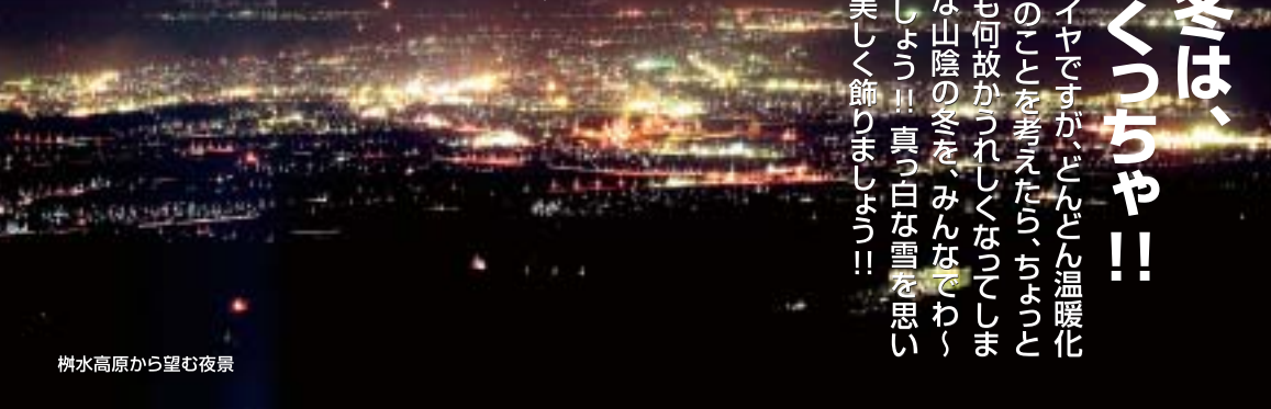
樹水高原から望む夜景

やっば冬は、 寒くなくっちゃ!! 雪道の通勤はイヤですが、どんどん温暖化している地球のことを考えたら、ちよっとくらい寒いのも何故かつれしくなっています。そんな山陰の冬を、みんなであつと楽しみましょ!! 真っ白な雪を思い思いの彩りで美しく飾りましょ!!