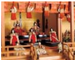
「永遠齋製作所観劇内裏舞台(さいとくさいせい)わくごてんつまたいりひなそらい」部分)明治時代

●全席自由/一般1000円(900円)、大学生・高校生500円(400円)※( )内は友の会、10名以上の団体料金※当日は各500円増 ●問い合わせ/TEL.0859-38-5127 (財)鳥取県文化振興財団